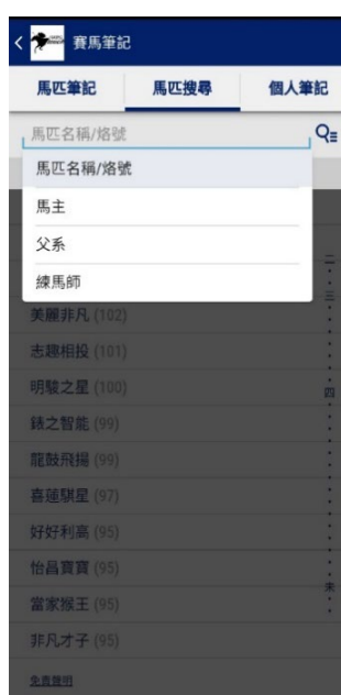
馬迷可透過「馬匹名稱/烙號」、「馬主」、「父系」或「練馬師」搜尋自己的筆記