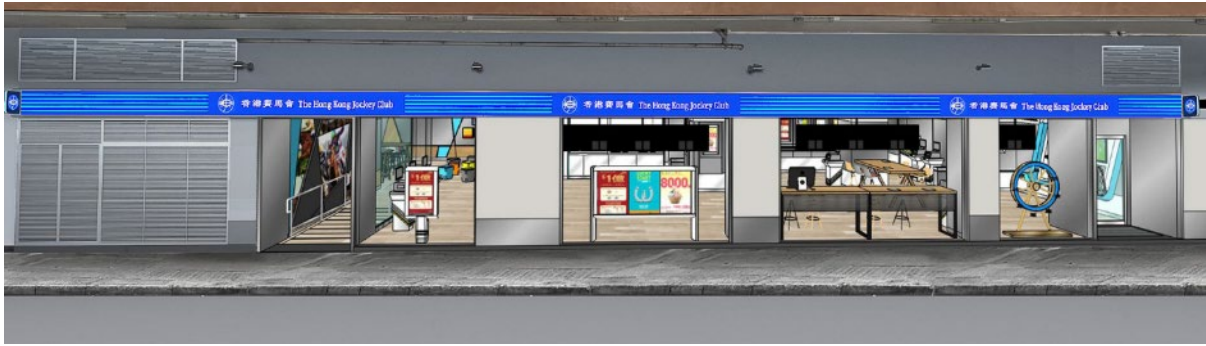
圖 4-6 -旺角登打士街投注處