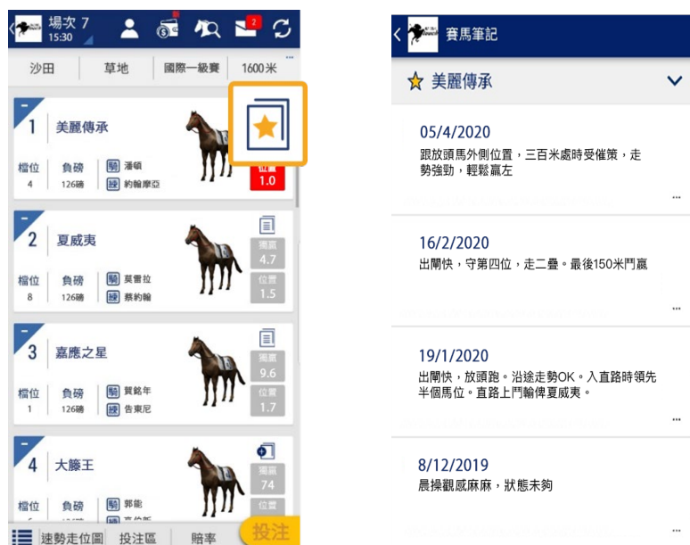
「賽馬筆記」圖示提醒馬迷重溫