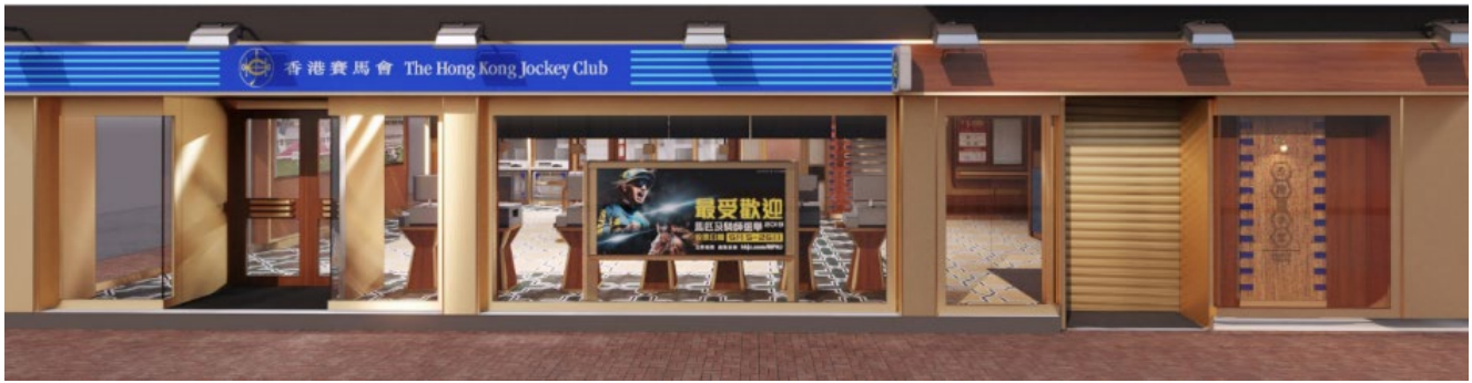
圖 1-3 -北角電氣道投注處