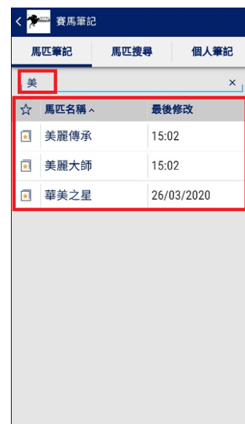
輸入關鍵字便可輕鬆搜尋個人筆記