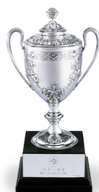
富衛保險冠軍一哩賽